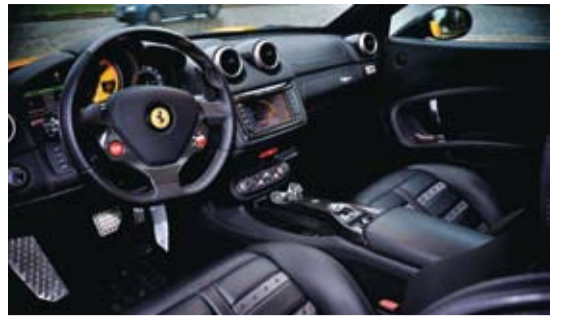
* Daniel Latif

Chez Ferrari chaque voiture reste unique grâce à foison de combinaisons possible en vue d'une personnalisation. Lors de la commande, Ferrari propose notamment d'équiper ses supercars avec des pneumatiques Michelin. Un choix qui peut se révéler judicieux quand on connaît les performances offertes par Bibendum : tenue de route prodigieuse, par temps de pluie, et une longévité kilométrique notoire. Ce sont évidemment les clés de la sécurité.